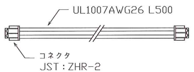
オプション部材/タイミング同期ハーネス