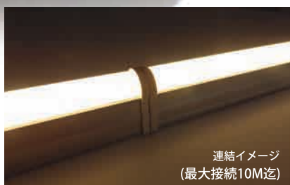
連結イメージ (最大接続10M迄)