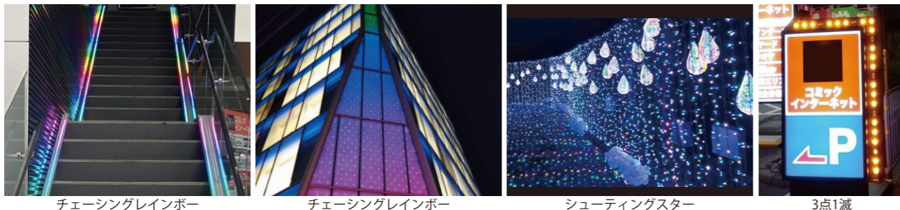
チェーシングレインボー